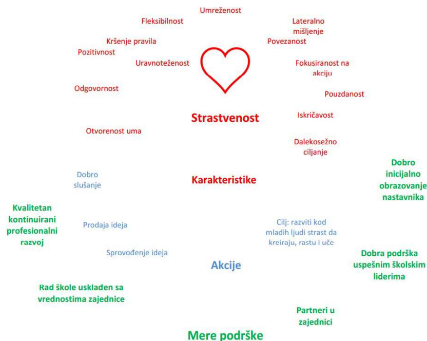
Slika 2. Nastavnik preduzetništva – karakteristike, akcije i mere podrške (EC, 2011: 8)

kao faktora uspeha . Izveštaj o obrazovanju i obuci nastavnika u pripremi za izazove preduzetničkog obrazovanja (EC, 2011), razmatraju se mogućnosti inicijalnog obrazovanja nastavnika preduzetništva, au dokumentima iz 2014. godine daju modeli inicijalnog obrazovanja i stručnog usavršavanja (EC, 2014). Očekivani ishodi osposobljavanja nastavnika za preduzetničko obrazovanje, odnosno nastavu usmerenu i ka preduzetništvu, rezultat su profesionalnog razvoja nastavnika i u različitim stadijumima, ali i u različitim kontekstima (slika 2).