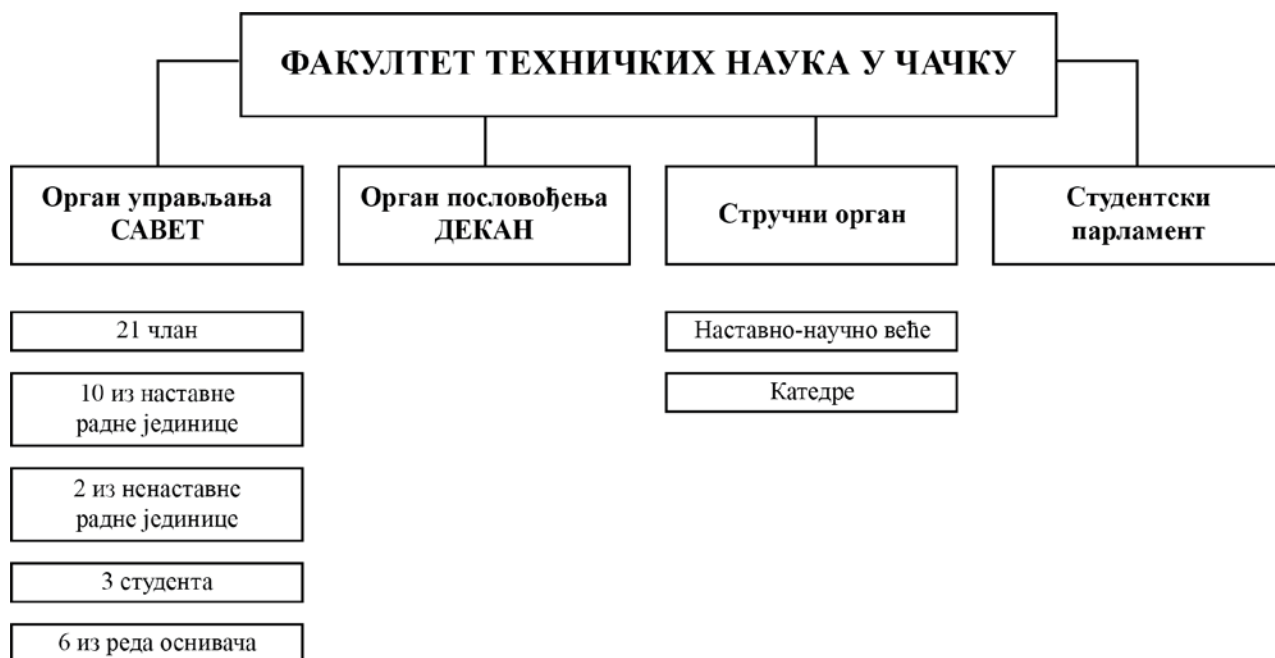
Шематска управљачка структура високошколске установе